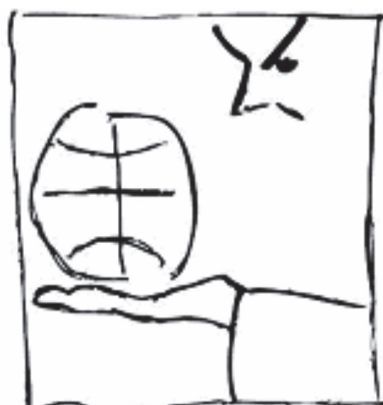
Рисунок автора книги

Новый Ренессанс не за горами – повсюду прорываются его симптомы и уже улавливаются шаги приближения Нового Человека, Человека дела, творца и гармонии